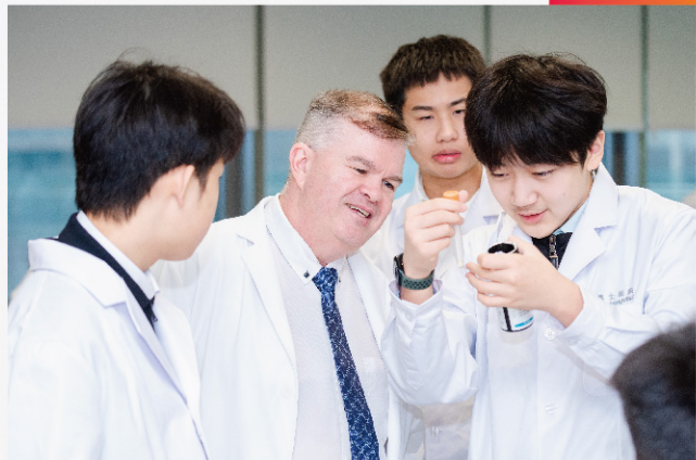
▲ 耀中耀华未来教育部活动——医疗学者项目

在迎来2023-2024学年之际，耀中耀华成立了“未来教育部”。学校请来许多专家，不只是昙花一现地来讲一堂课，而是与学生们一起研究、讨论。像是2023年3月的粒子物理大师课上，经过为期一周