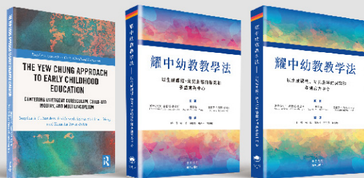
▲ 2024年儿童节之际，《耀中幼教教学法》中文版发布。其英文版由世界顶级学术出版机构劳特利奇出版社 (Routledge) 于2022年出版发行。

耀中耀华的 教学方案 中也明确规定：自由游戏中，领导者是孩子，而不是教师。上海耀中的一位幼教部老师曾记录她观察的一个案例：两个孩子踩着地上贴着的脚印狭路相逢，由于都想先走一步而僵持不下。在等候了2分钟之后，其中一个孩子提出采用“石头剪刀布”的方式决定谁先走，最终顺利打破了僵局。